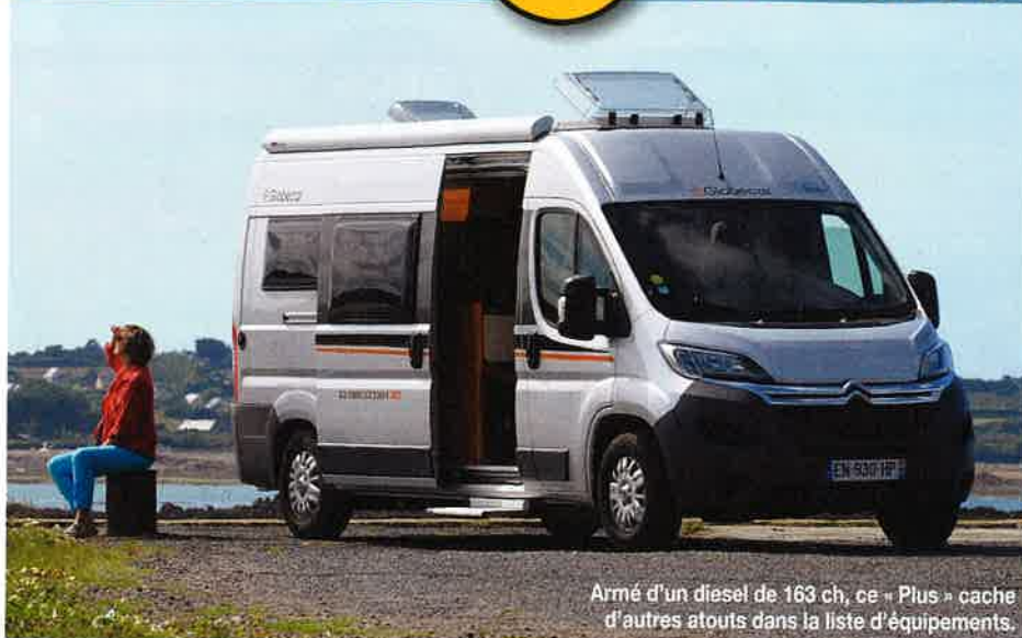
Armé d'un diesel de 163 ch, ce « Plus » cache d'autres atouts dans la liste d'équipements.